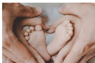
6 Varia Arbeidsrecht en sociaal zekerheidsrecht