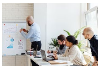
10 Overige corona-actualiteiten voor werkgevers