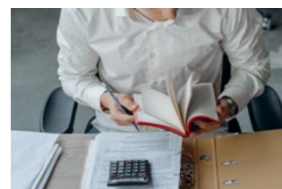
8 Tijdelijke Noodmaatregel Overbrugging Werkgelegenheid