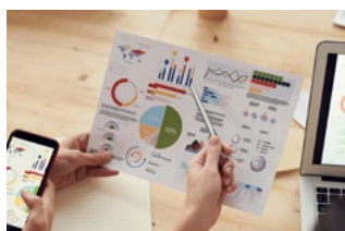
5 Wet DBA