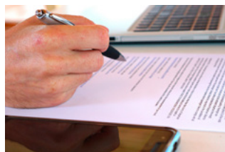
6 Varia Arbeidsrecht