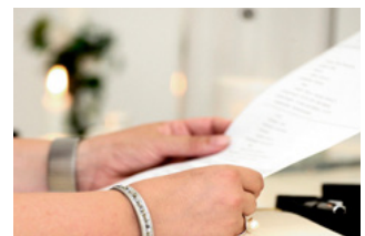
8 NOW (Tijdelijke Noodmaatregel Overbrugging Werkgelegenheid)