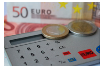
4 Wet tegemoetkomingen loondomein