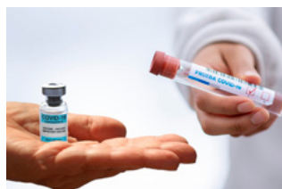
10 Overige corona-actualiteiten voor werkgevers