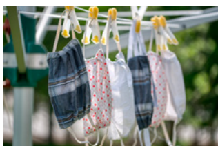
9 Corona en bijzonderheden werknemer