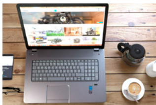
5 Wet DBA