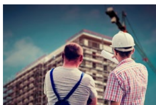
5 Wet DBA