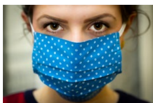
9 Corona en bijzonderheden werknemer