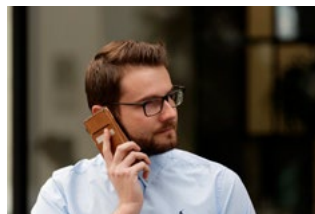
2 Wet arbeidsmarkt in balans (WAB)