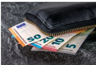
1 Varia loon- en premieheffing

Wij willen voldoen aan de wens om actueel te zijn. Maar terwijl we aan het schrijven zijn, komen er vanuit de overheid telkens nieuwe aanvullingen op of verbeteringen van (nieuwe) regelingen door corona. Het overzicht in deze special is geschreven met de kennis tot en met 15 juni 15:00 uur.