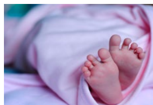
7 Varia Arbeidsrecht