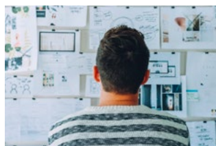
6 Wet DBA